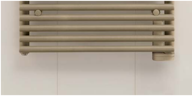
Ausführung Elektrobetrieb mit eingebauter Elektro-Heizpatrone.